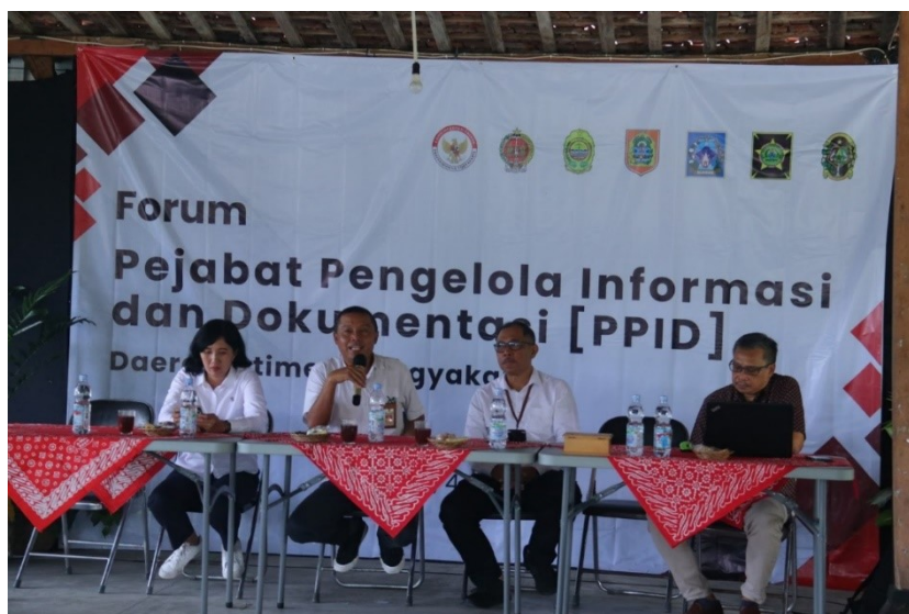
Gambar 6 Dokumentasi Forum Pejabat Pengelola Informasi dan Dokumentasi (PPID) bertempat di Kampong Mataram pada 4 Juni 2025