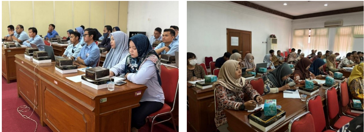
Gambar 11 Kolase Dokumentasi Aktivitas Pendampingan PPID Perangkat Daerah di Mandhala Saba Purwa pada Selasa, 5 Agustus 2025 (kiri) dan Kamis, 7 Agustus 2025 (kanan)