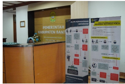
Gambar 4 Informasi Tambahan Pendukung Layanan Informasi Publik berupa Maklumat Layanan Informasi, Alur Pelayanan/Keberatan Informasi, Jadwal Layanan, dan Tarif atas Layanan Informasi