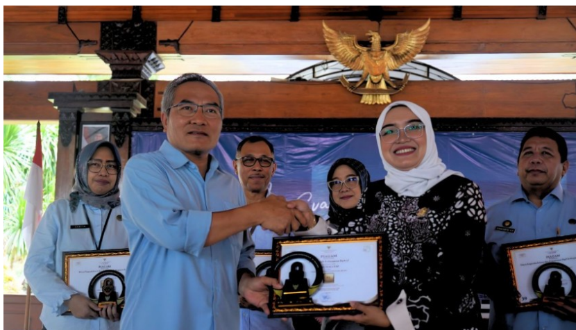
Gambar 13 Evaluasi dan Pemberian Penghargaan bagi PPID Perangkat Daerah di Pendopo Parasamya pada Selasa, 2 Desember 2025