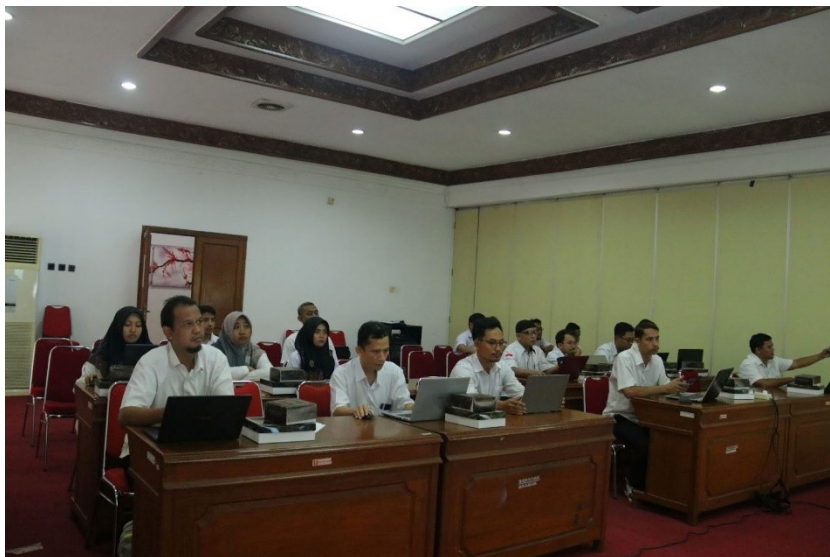
Gambar 10 Pendampingan bagi Kalurahan di Kabupaten Bantul Peserta Monev Keterbukaan Informasi Publik Tahun 2025 pada Rabu, 13 Agustus 2025 di Ruang Mandala Sabha Pracima