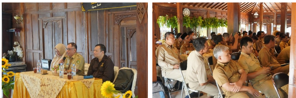
Gambar 8 Dokumentasi Aktivitas Sosialisasi dan Pembinaan PPID Kalurahan di Joglo Ageng WOS pada Senin 23 Juni 2025