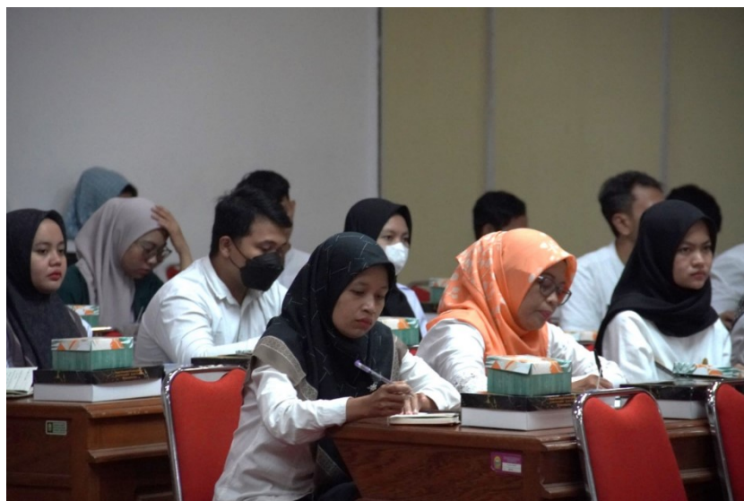
Gambar 7 Dokumentasi Pembinaan PPID Pelaksana Badan Publik se-Kabupaten Bantul dalam pertemuan bertempat di Mandala Saba Madya pada Rabu 18 Juni 2025

Kabupaten Bantul bertempat di Joglo Ageng WOS pada Senin 23 Juni 2025 dengan dokumentasi pada Gambar 8.