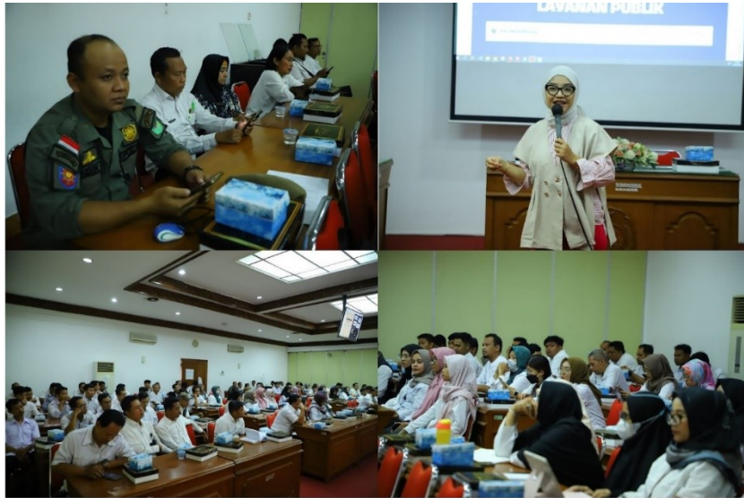
Gambar 12 Kolase Dokumentasi Workshop Peningkatan Kapasitas Admin PPID pada Rabu 24 September 2025 yang dilaksanakan di Mandhala Saba Madya