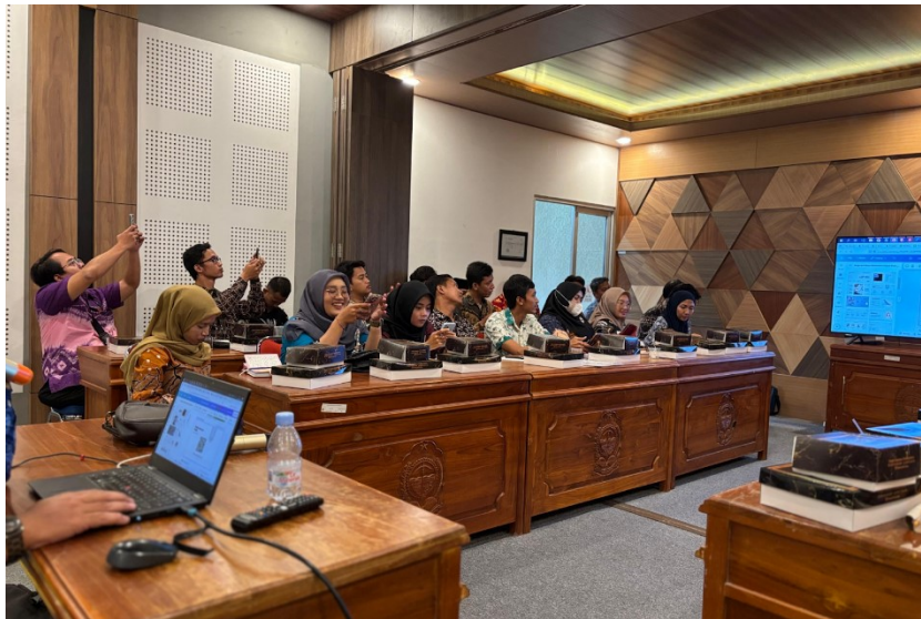
Gambar 9 Pendampingan bagi Kalurahan di Kabupaten Bantul yang Mengikuti Monev Tahun 2025 pada Kamis 17 Juni 2025