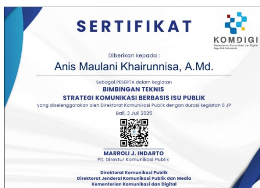
Gambar 5 Bukti Pelaksanaan Program Pengelolaan dan Pengembangan SDM PPID dan PLID berupa Sertifikat Pelatihan

Badan Publik Pemerintah Kabupaten Bantul juga melaksanakan program pengelolaan dan pengembangan SDM PPID dan PLID untuk mendukung layanan informasi publik. Badan Publik telah menerbitkan Surat Perintah Tugas khusus yang dapat digunakan sebagai bagian dari Sasaran Kinerja Pegawai (SKP) dan indikator kinerja perorangan lainnya. Selain itu Badan Publik telah memastikan bahwa tim PLID memiliki kompetensi/skill yang relevan dengan tugas dan telah menyelenggarakan atau mengirimkan peserta diklat/bimtek terkait keterbukaan/layanan informasi publik yang dibuktikan dengan sertifikat pelatihan seperti pada Gambar 5.