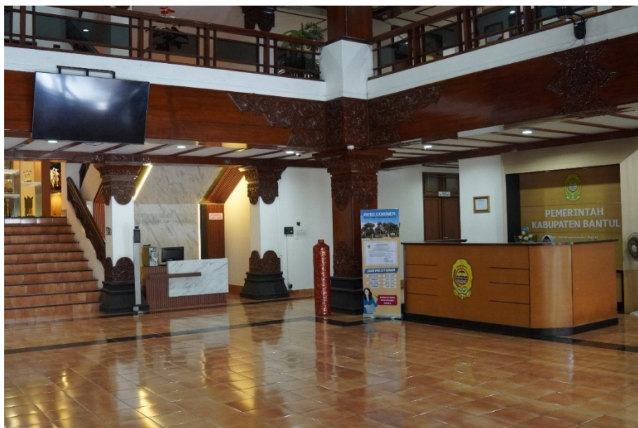
Gambar 1 Ruang Layanan Informasi Publik pada Lobi Gedung Induk Komplek Parasmya di Jl. Robert Wolter Monginsidi No.1 Bantul

juga terdapat buku register, papan pengumuman/ running text , serta form permohonan dan keberatan yang berbentuk hardcopy .